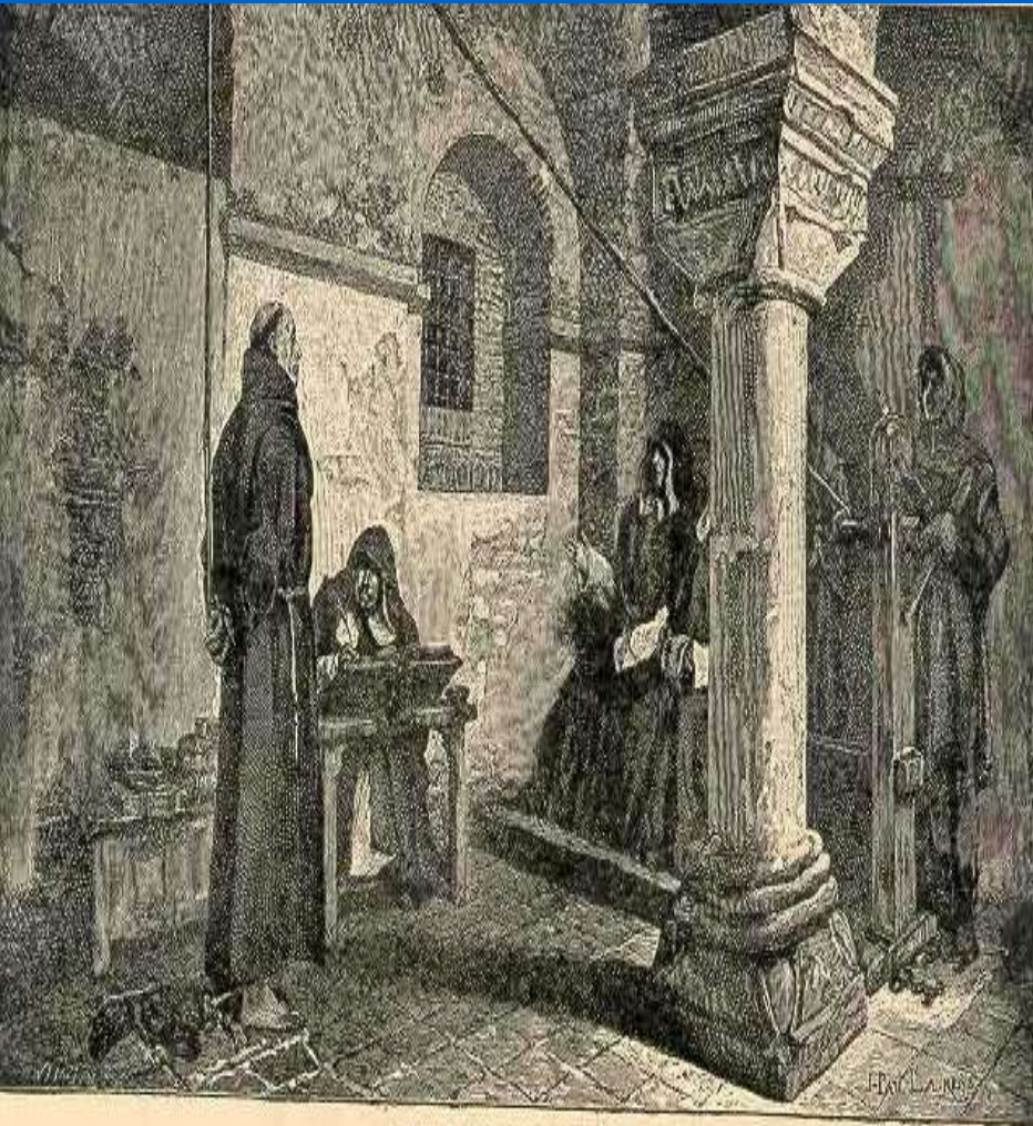
BEFORE THE INQUISITORS.